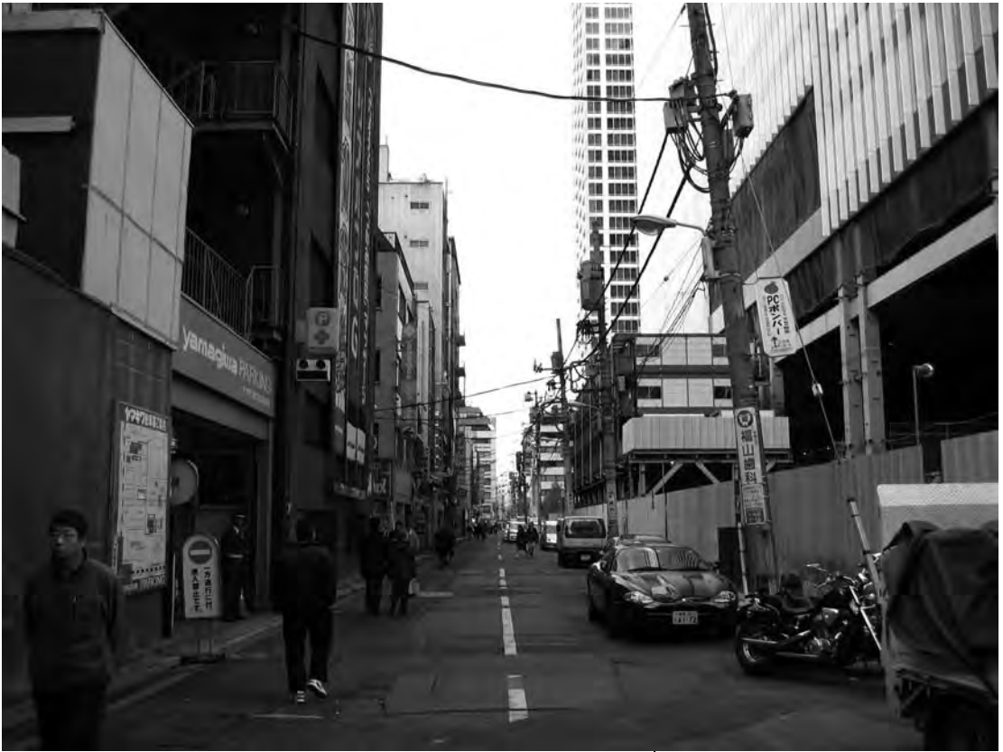
千代田区外神田四丁目